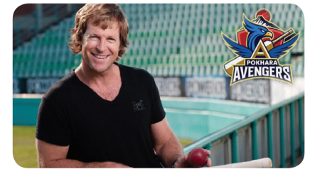
१५ मंसिरमा सुरु हुने आईपिएलमा पोखरा एडभन्सरमा आवद्ध दक्षिण अफ्रिकाका जोन्टी रोड्स