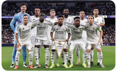
युरोपेली च्याम्पियन्स लिगमा रियलले डर्टमन्डलाई हराएको छ